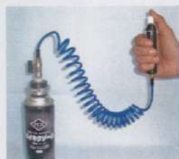
[バイキクゾール]超残留、速乾塗布剤 [メンターゾール]無臭・即効性No.1