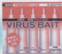
[ウィルスベイト] PFDNVウィルスのドミノ効果で害虫の卵から繁殖源まで撲滅します。