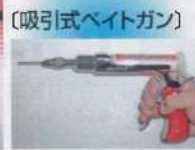
[吸引式ベイトガン]