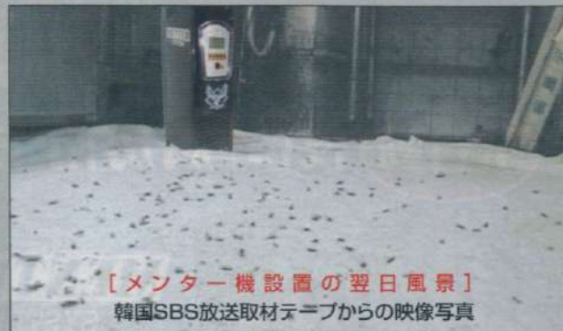
[メンター機設置の翌日風景] 韓国SBS放送取材テープからの映像写真

模倣、追従を許さない効果の違い!! (特許取得) ゴキブリ完全防除の「メンターシステム」の一部であるハード効果だけで恐縮ですが、無色透明、無残留のドライ方式と、特許技術による圧倒的な効果の違いをご確認ください。(冬場でも安定効果) [設置所要時間は5分程度、電気代は1日7円程度です。]